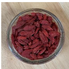
Baies de Goji