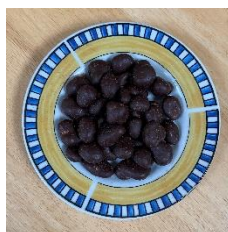
Cranberries enrobées de chocolat