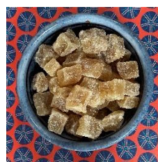
Gingembre confit en cubes