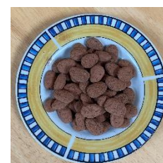
Amande enrobées de chocolat