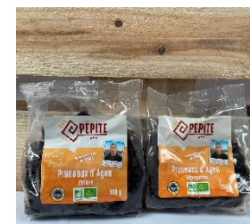
Pruneaux entiers et dénoyauté